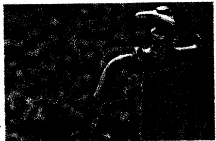
水道が利権の温床になる？

化設備投資も含めた海外ファンドを間の中で儲けさせるシステムが、今回の民営化と言えます」