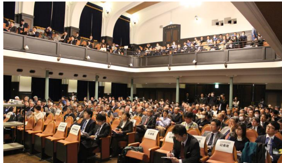
講演会場 一階席と二階席